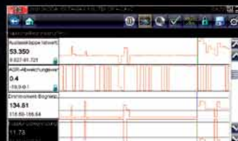
Hochauflösende grafische Darstellung von bis zu 4 Parametern mit Zoom, PID Triggerung und persönlicher Parameterauswahl