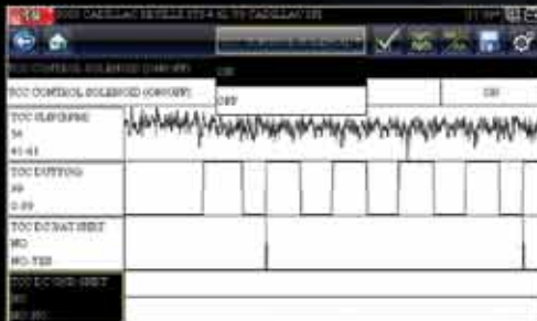
Bidirektionale Kontrollfunktionen während der Datenanzeige zur Diagnose von Ursache und Wirkung