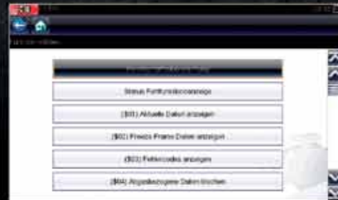
EOBD Diagnose an allen Fahrzeugen Otto ab 2001/Diesel ab 2004